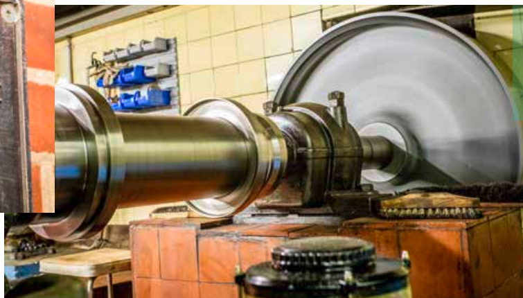
Wasserenergie rund um die Uhr: Die Turbine läuft 8.000 Stunden im Jahr.